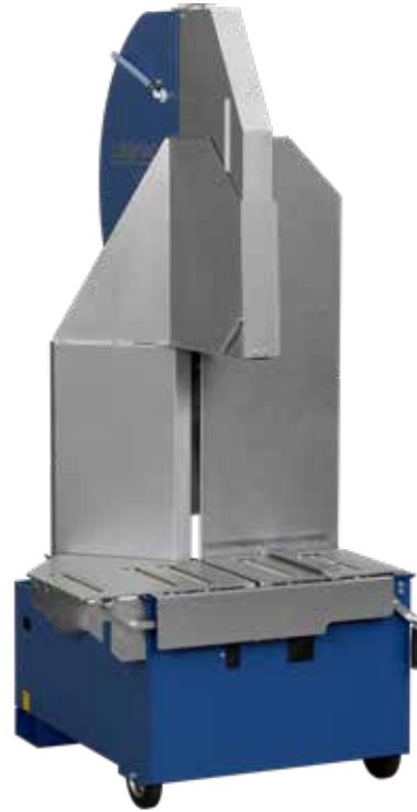
DTS 420 PE/N