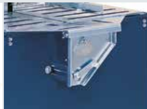
[ 3 ] Zusatztisch